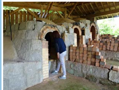
窯元の登り窯見学