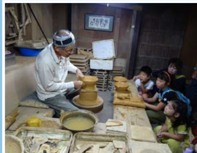
伝統技法の実演見学